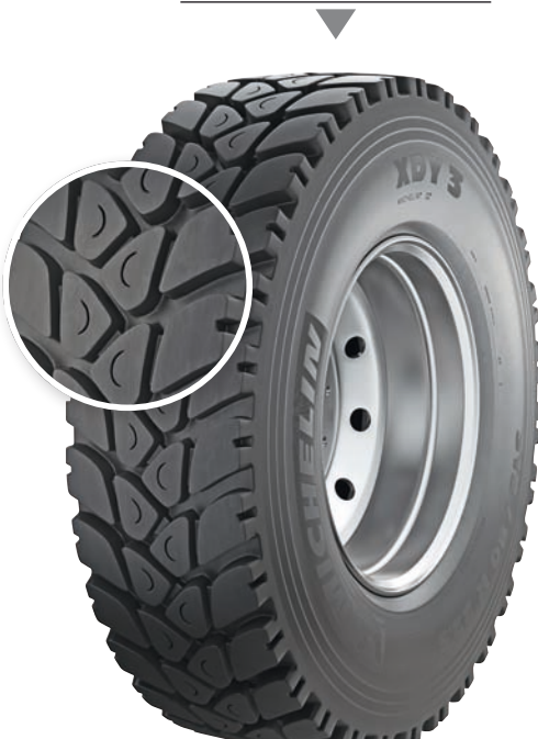
MICHELIN XDY 3