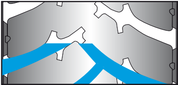
ESQUEMA DE REESCULTURADO

Reesculturable y renovable en MICHELIN Remix