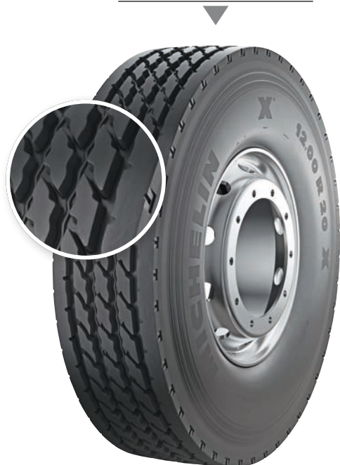
MICHELIN XZY 2