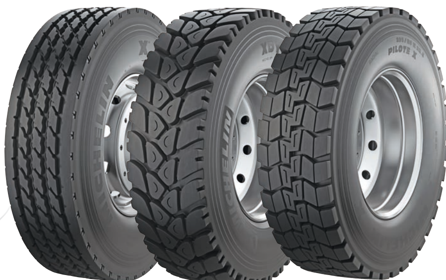
MICHELIN XDY +